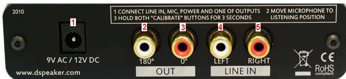
Afbeelding 2: ANTI-MODE 8033S, achterzijde