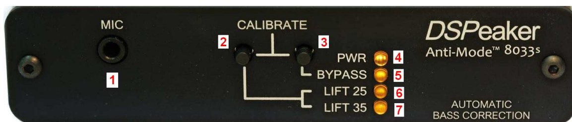
Afbeelding 1: ANTI-MODE 8033S, voorzijde